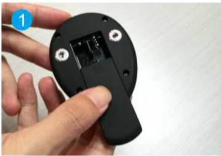
1. Otworzyć komorę baterii