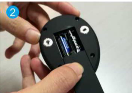
2. Włożyć baterie (2xAAA)